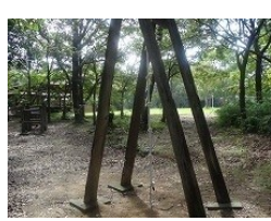
⑥ ロープをのぼります