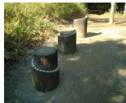
②台の中央に立ち、膝を曲げずに両手を低い目盛りに付けます