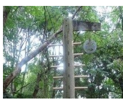
⑫ 上部の鐘をならします