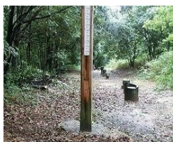
①片手を真上に伸ばし、ジャンプしたときの高さを測ります