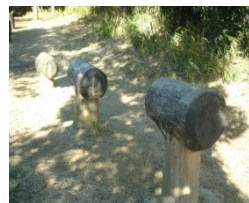
③馬跳びの要領で順番に跳びます