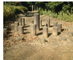
④ 跳石のように跳びます