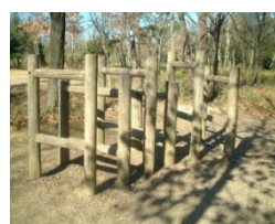
⑦ 丸太の枠をくぐります