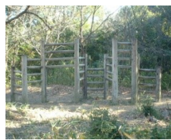
⑪ 丸太を横向きで渡ります