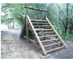
⑩ ロープにつかまりながら丸太の上をこえます