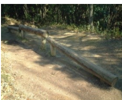
⑤ 丸太の上を歩きます