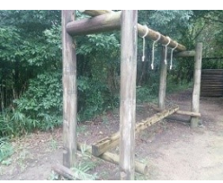
⑨ ロープにぶら下がりながら渡ります