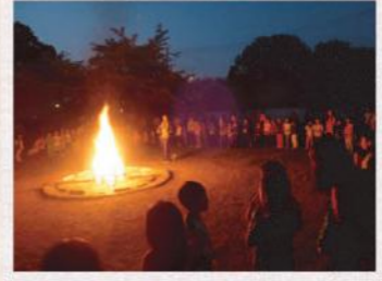
キャンプファイア