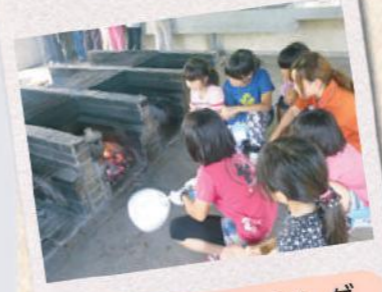
アウトドアクッキング