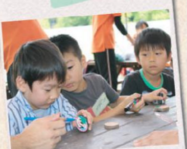
ネイチャークラフト