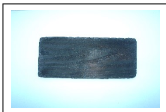
② 杉板を全面が黒くなるまで焼きます