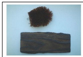
③ ススが取れるまでタワシで磨きます