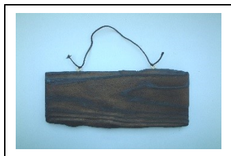
④ ヒートンとくみひもを取り付けます