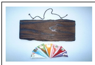
⑤ ペイントックスで絵や文字を描きます