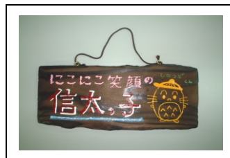
⑥ 焼板の壁飾りの完成です

そ の 他 : 希望があれば、スタッフが作り方を指導します。 バーナーの取り扱いには十分に注意しましょう。